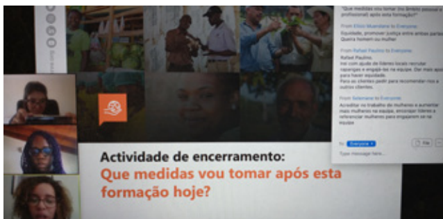
Imagens das duas formações sobre Preconceitos Inconscientes com equipas de Fenix (de forma presencial e virtual).

A Fenix e o WIN avançam na implementação das actividades definidas após a análise de género realizada nas operações da empresa. As actividades visam permitir que a Fenix chegue a mais mulheres clientes e a recrutar mais mulheres como agentes. Nesse contexto, a equipa WIN facilitou duas rondas de formação sobre os Preconceitos Inconscientes.