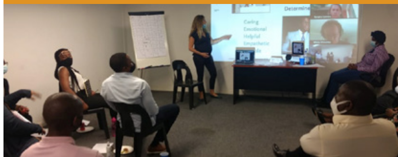
Images from two trainings on Unconscious Bias with Fenix team (in-person and virtual)

Fenix and WIN progressed with the implementation of activities determined as a result of the gender analysis of the company's operations. These activities are designed to help Fenix reach more women clients and recruit more women as agents. WIN facilitated two rounds of training on Unconscious Bias for the Fenix team.