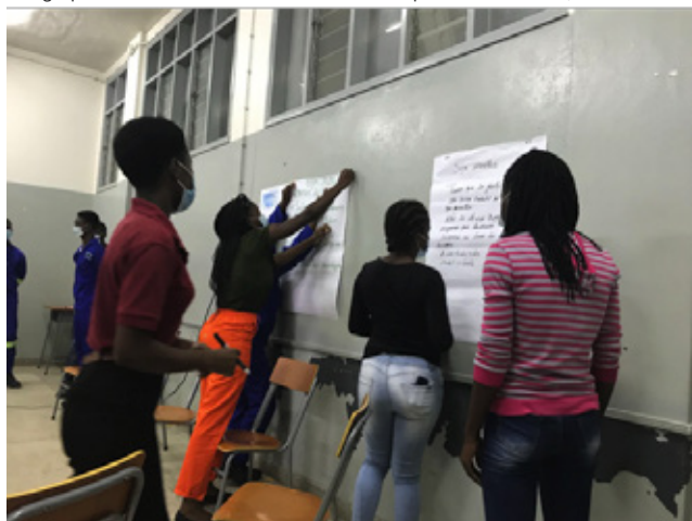
Um grupo de estudantes voluntários durante o piloto no IFPELAC, em Malhazine

Os próximos passos serão finalizar o manual com as descobertas da formação piloto, disseminar o manual para todos os centros vocacionais, e conduzir Formações de Formadores em vários institutos públicos de formação do país.