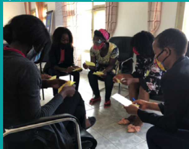
A group of volunteer students during the pilot in IFPELAC of Malhazine

The next step is finalizing the manual with the findings from the pilot, disseminating it to all the vocational centres and training teachers throughout the country on the approach.